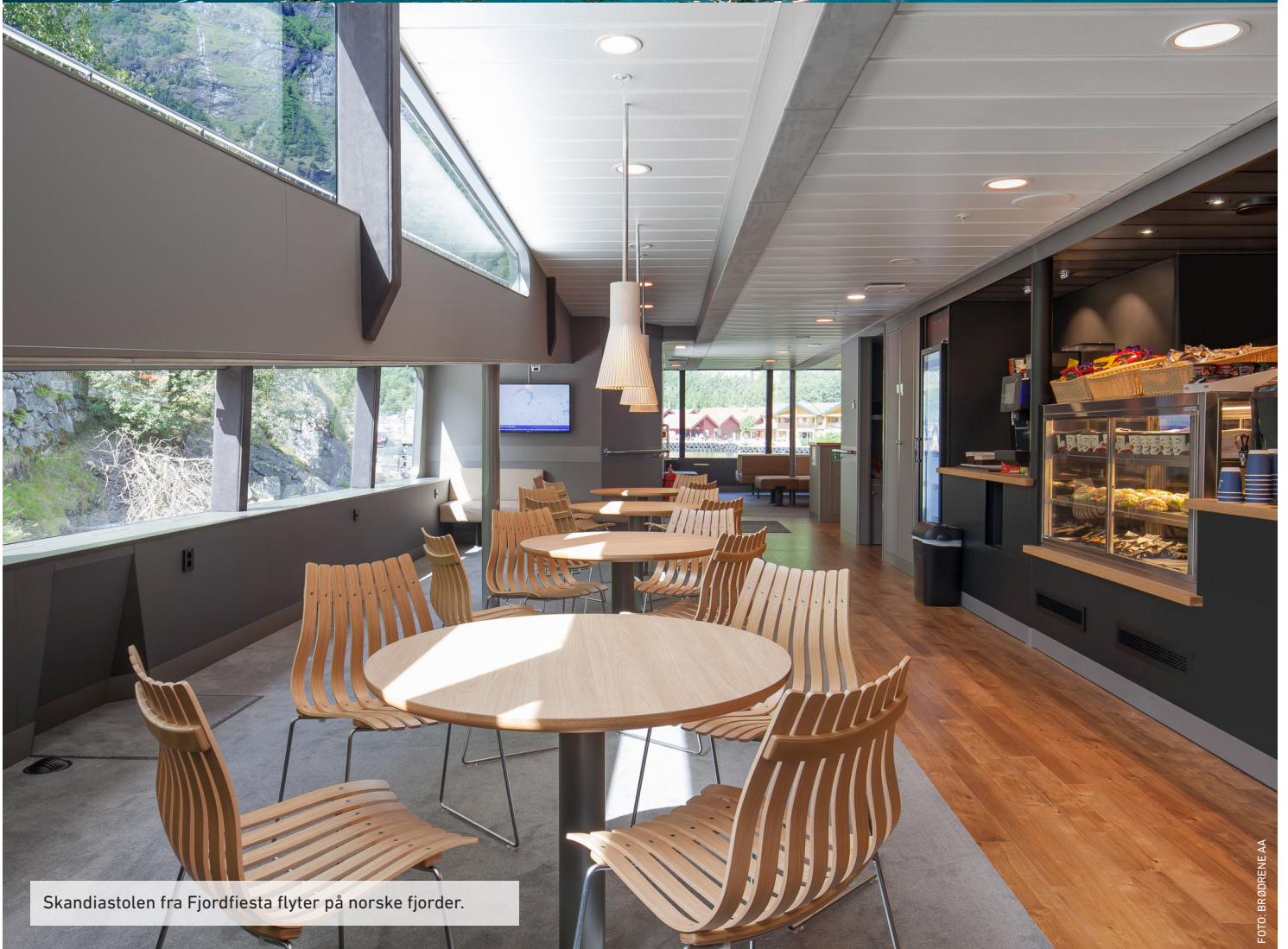
Skandiastolen fra Fjordfiesta flyter på norske fjorder.