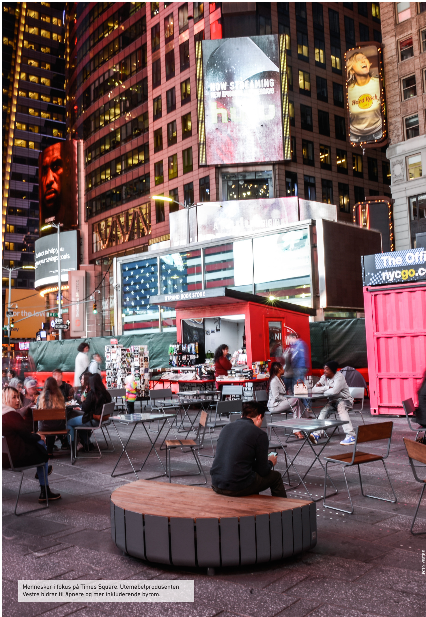
Mennesker i fokus på Times Square. Utemøbelprodusenten Vestre bidrar til åpnere og mer inkluderende byrom.