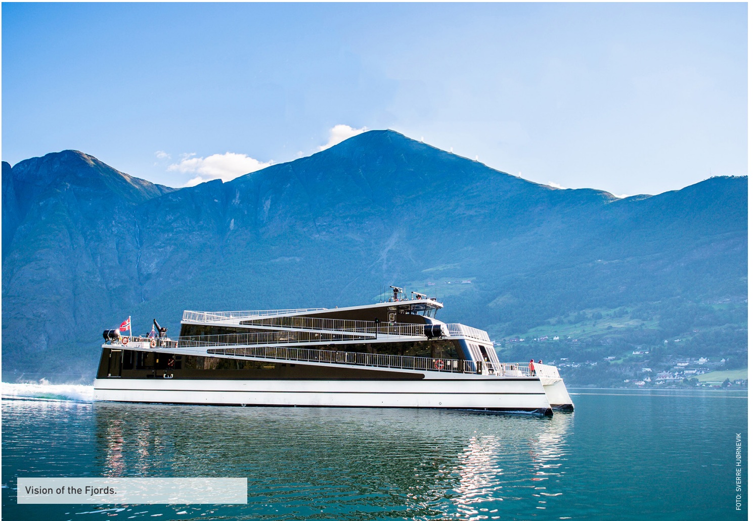
Vision of the Fjords.